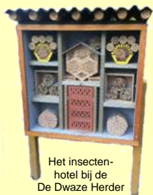
Het insectenhotel bij de Dwaze Herder

Ook in het klein kan er veel gedaan worden: maak de tuin niet al te 'winterklaar' en laat hoopjes bladeren en takjes liggen. Daar vinden veel insecten in de winter een goed heenkomen.