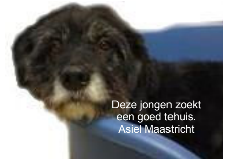
Deze jongen zoekt een goed tehuis. Asiel Maastricht

In Capelle aan de IJssel worden vanaf mei twee getrainde opsporingsambtenaren, een soort dierenpolitie, aangesteld om dierenleed op te sporen en aan te pakken. Het is een proef van een jaar.