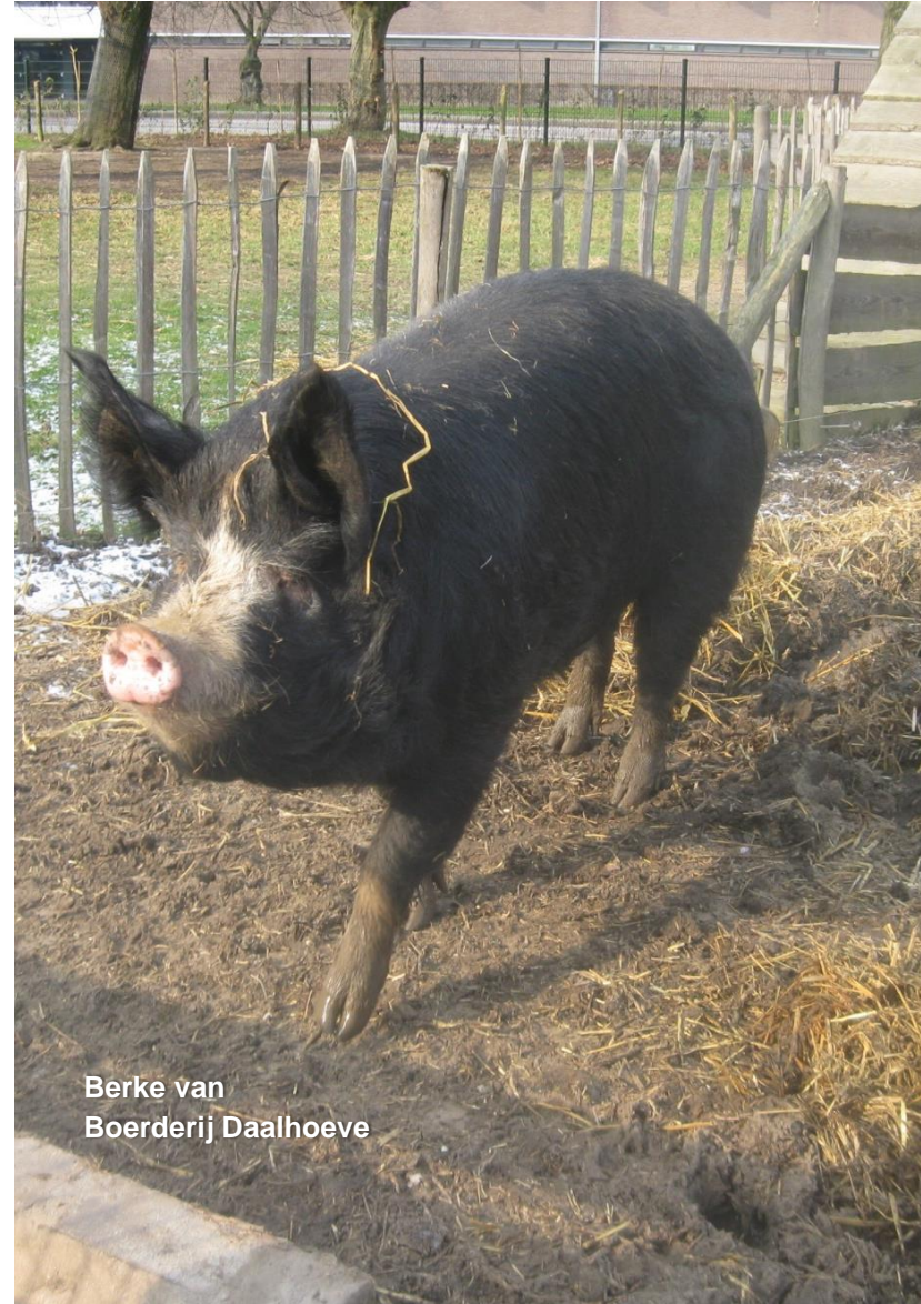
Berke van Boerderij Daalhoeve