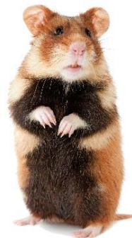
Veldhamster of Korenwolf

www.zoogdierverseniging.nl/zoogdiersoorten/hamster