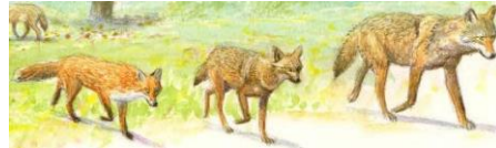
vos goudjakhals wolf

(uitsnede uit poster, gratis te downloaden van https://www.ark.eu/ )